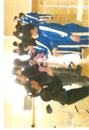
6年生へプレゼント

会場中が温かい雰囲気になり、そして感動の嵐に包まれた、素晴らしい6年生を送る会でした。