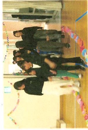
1・2年生に手を引かれて入場