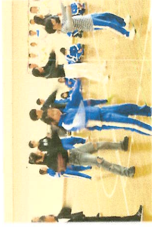
3年生と一緒に「ソーラン」