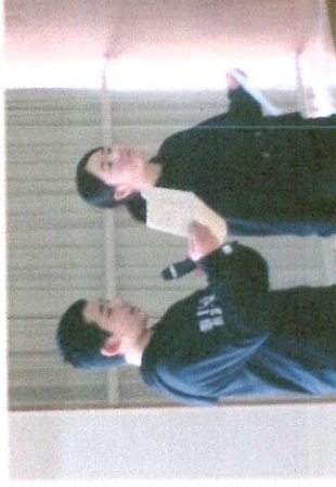
6年生の出し物 司会はこの二人