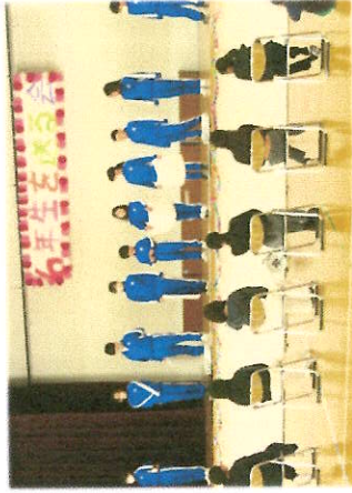
4年生は6年生に関するクイズ