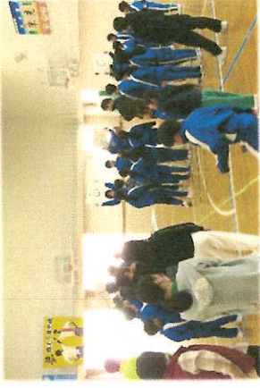
5年生は6年生とゲームで対決