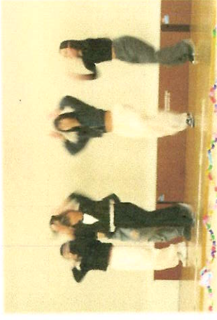
6年生はダンスでお礼を（女子チーム）