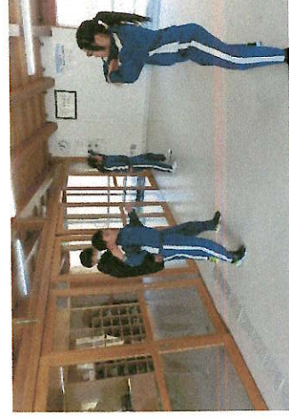
6年生から3年生へ ソーラン引継ぎ